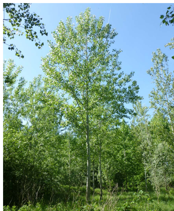
Parcelle INRAe, Heilly (80) à 6 ans ▲